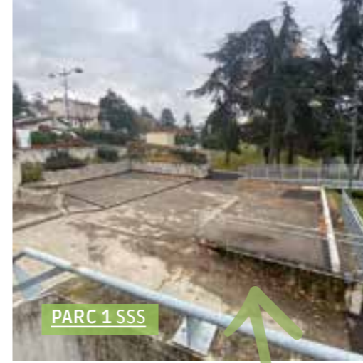
PARC 1 SSS