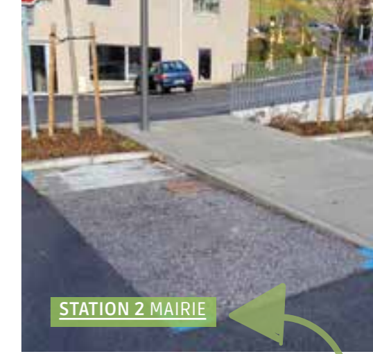
STATION 2 MAIRIE