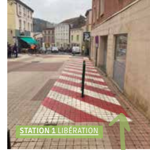
STATION 1 LIBÉRATION