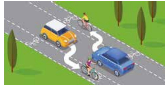
Avenue Jean Faure

Rejoindre le centre du village c'est aussi pouvoir pédaler en sécurité. Pour la première fois à Saint-Etienne Métropole, nous avons, comme promis, proposer à la DGTI, la mise en valeur du cycle sur l'avenue Jean Faure. Une zone test va voir le jour depuis les Perrotins jusqu'à la rue de Bel-air. Comme vous le voyez sur le croquis, la voie de 5,5m sera partagée en trois. Deux voies pour les vélos et une voie centrale pour les automobiles.