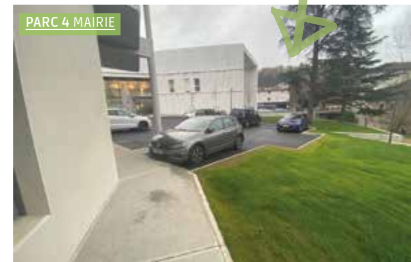
PARC 4 MAIRIE