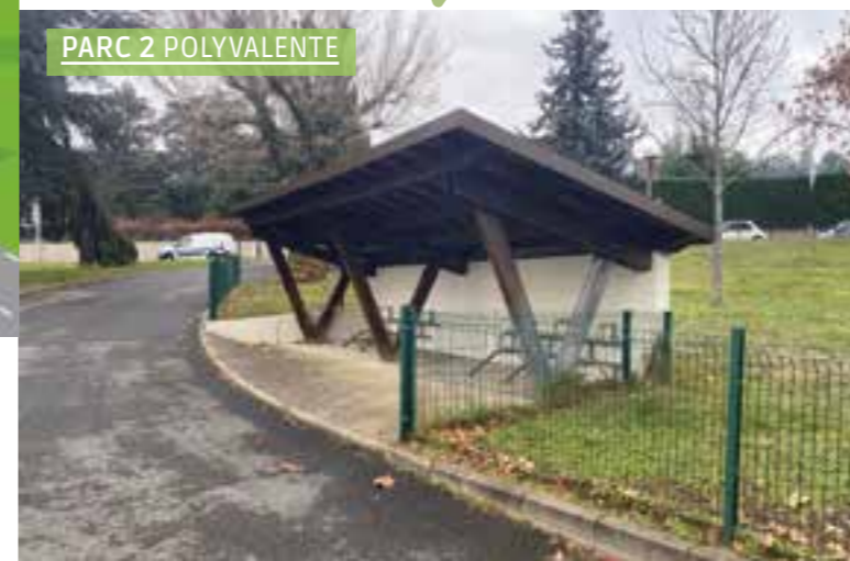
PARC 2 POLYVALENTE