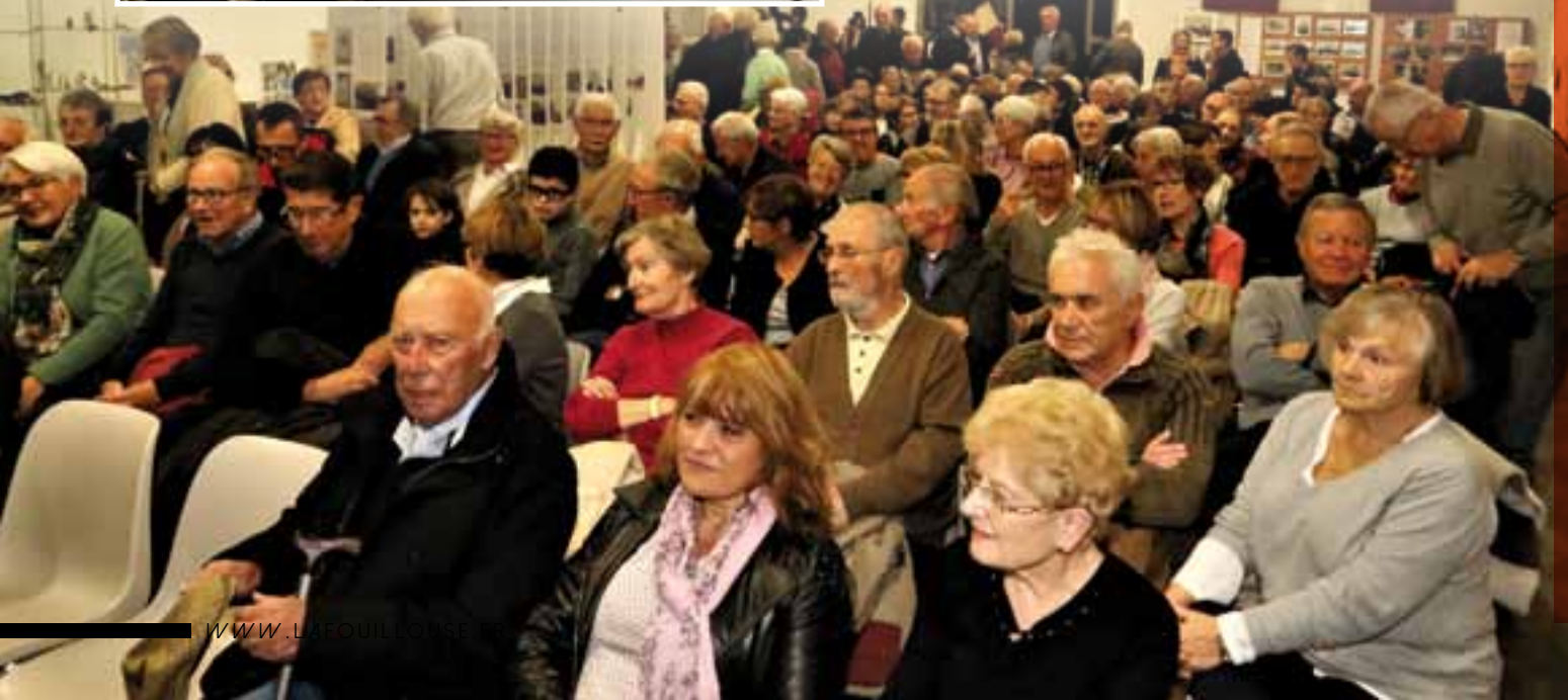
Un Jardin d'Hiver plein à craquer pour cette soirée conférence