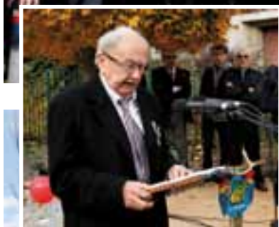
81 ballons, un part Poilu, ont été lâchés dans le ciel