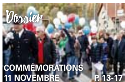
COMMÉMORATIONS 11 NOVEMBRE