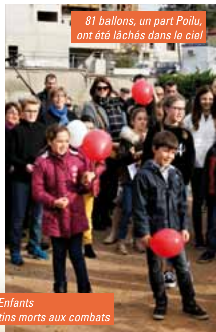
Les élèves du Conseil Municipal des Enfants ont lu les noms des 81 Poilus Feuillantins morts aux combats