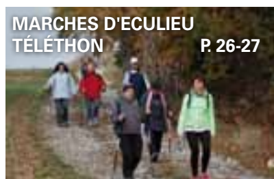
MARCHES D'ECULIEU TÉLÉTHON