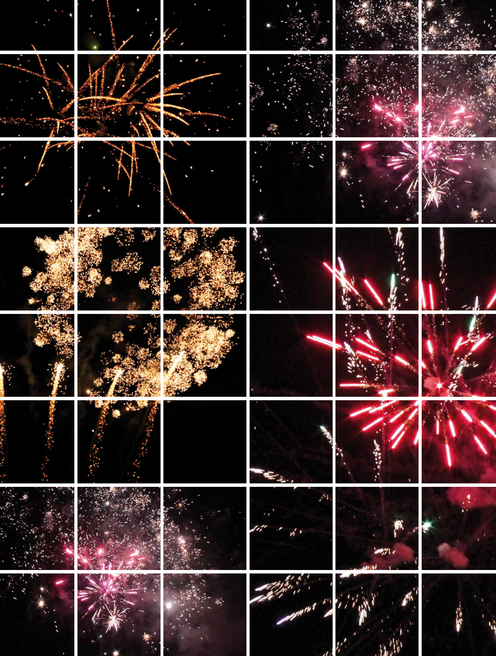
LE CIEL CONSTELLÉ D'ÉTOILES AU-DESSUS DU PARC DES CÈDRES... IMAGES ÉPHÉMÈRES... TOUTE LA MAGIE DU FEU D'ARTIFICE !