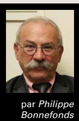
par Philippe Bonnefonds

Depuis des mois les travaux se sont multipliés un peu partout dans le village... entraînant pour la plupart des Feuillantins de grosses gênes au niveau de la circulation, du stationnement, de la vie quotidienne en général.