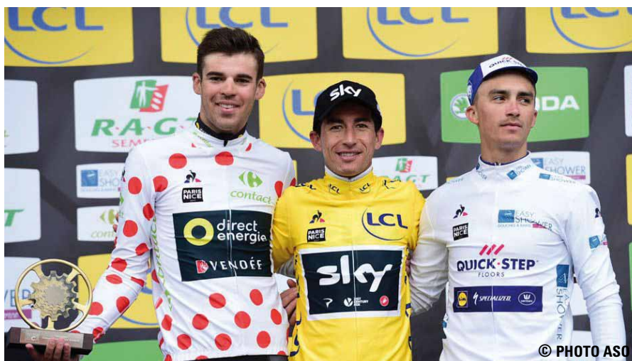
Le podium 2017 de gauche à droite : Lilian Calmejane, Sergio Henao, Julian Ala Philippe.