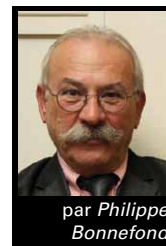
par Philippe Bonnefond