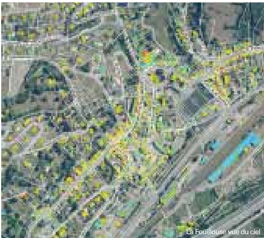
La Fouillouse vue du ciel

SEM a réalisé sa thermographie aérienne de toutes les communes de son territoire. Ces données ne sont ni transmises ni accessibles aux artisans du bâtiment. Si un artisan vous contacte en prétendant s'appuyer sur les données de thermographie aérienne, méfiez-vous et contactez votre mairie.